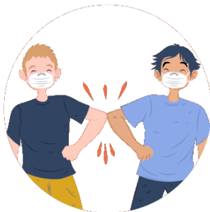
Toque de cotovelos